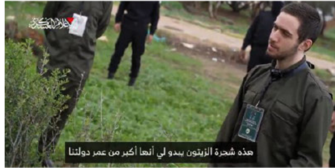
هذه شجرة الزيتون يبدو لي أنها أكبر من عمر دولتنا

وأضاف وهو يتأمل الفروع التي أنبتتها الشجرة "أنظر ماذا فعلت شجرة الزيتون هذه، يبدو أن عمرها 100 عام" كما تحدث أحدهم عن جذور عائلته، فقال إن أصول أجداده تعود إلى المغرب وتركيا وأنه لا يعرف السبب الذي دفع جده للمجيء إلى هذه المنطقة، مشدداً أن على الجميع العودة إلى موطنهم. يأتي ذلك بينما رفعت حماس شعار شجرة الزيتون، على منصة إطلاق سراج الأسرى، التي أقامتها في منطقة النصيرات وسط القطاع. كما رفعت شعاراً كتبه بالعربية والإنجليزية والعبرية: "الأرض تعرف أهلها.. من الأعراب مزدوجي الجنسية"، وفق موقع "آر تي عربي" ■