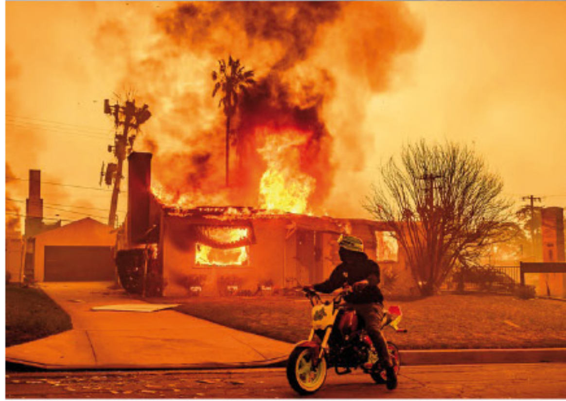
جنوب ولاية كاليفورنيا، وهي ثاني أكبر مدينة ومنطقة حضرية من حيث عدد السكان بعد مدينة نيويورك في الولايات المتحدة، وتتألف من ثمانية حيا وضاحية.

لا تزال الحرائق تلتهم مدينة لوس أنجلوس جنوب ولاية كاليفورنيا الأمريكية منذ مساء الثلاثاء 7 يناير، حتى باتت تصفها السلطات بأنها الكارثة الطبيعية الأشد فتكا في التاريخ الحديث، للمدينة ذات الأحياء الثرية والتي تحتضن هوليوود، المركز التاريخي للسينما الأمريكية والممثلين الأمريكيين. وتسببت الحرائق في وفاة 24 شخصا، وغطت الحرائق مساحة تقدر بحوالي 35 ألف دونم، أي ما يقدر بنحو 2.5 مرة أكبر من مساحة مانهاتن، واضطر أكثر من 150 ألف شخص إلى إخلاء منازلهم. ومن أجل السيطرة على الحريق، تطلب الأمر مساعدة سبع دول مجاورة والحكومة الفيدرالية وكندا، وشارك الآلاف من رجال الإطفاء في العمل الشاق.