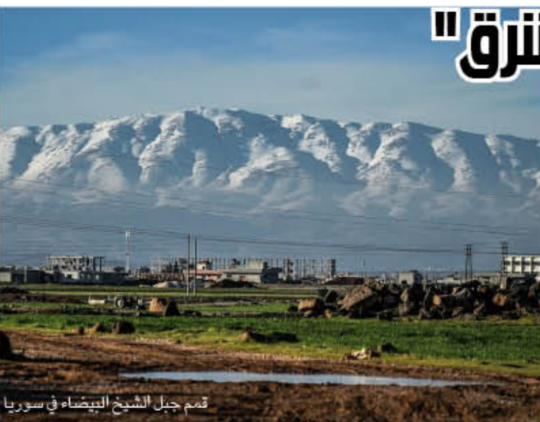
تمم جبل الشيخ البيضاء في سوريا

يقول محللون للموقع البريطاني إن أنظمة الرادار الإسرائيلية كانت بها في السابق نقطة عمياء كبيرة، مما يسمح