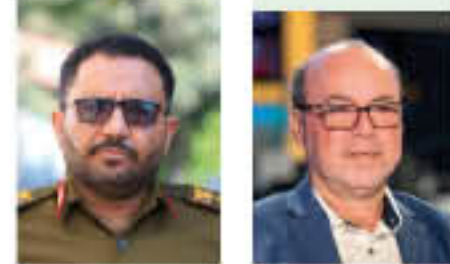
نتيعيب: استهداف علو كعب القادة العسكريين اليمنيين وهدم الطولي

إن العمليات العسكرية التي قامت بها القوات المسلحة اليمنية تجاه حاملات الطائرات الأمريكية "إبراهام" في البحر الأحمر وتجاه الممرتين الأمريكيتين بالبحر الأحمر تعتبر عمليات جبارة وجرينة وناجحة واستباقية وغير مسبوقة، وفق ما أفاد عميد الجيش العميد يحيى سريع، وهو قائد لاصطاف البحر الأحمر مع حاملات الطائرات الأمريكية "إبراهام" أنت في وقت حساس وخرج وأوصلت رسائل كثيرة لكل دول العالم حيث استمرت 8 ساعات ما يعني أن العملية لم تكن مجرد استهداف وإنما حرب ضروس، كانت خاضعة للنصر لليمن ولقواته المسلحة. وتابع العميد: "الاصطاف البحرية هي للاسبوعاض فحسب، فهي لا تستطيع أن تصعب كثيراً أمام أي مواجهة حقيقية، ولن تكون صعب من مواجهة 17 دولة، وبالتالي يبقى مجرد أسطول مكشوف وواضح حتى وإن كان يحمل ألف صاروخ مضاه".