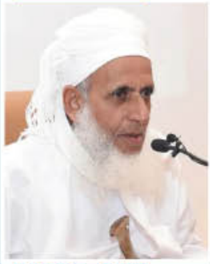
الشيخ أحمد الخليلي

لله در مفاوير اليمن الأبطال الذين واجهوا قوى الاستكبار بعزيمة تفتت الصخر الصلاد، وتهدد النعم الرواسي فقد لغنوا الصهيونية ومن ورائها دروساً لن ينسوها.